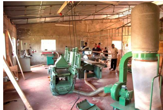
Kenia Schreiner Ausbildung